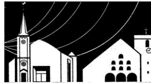
Kirche St. Michael; Kölner Str. 37 Kirche St. Apollinaris, Grunewald 23